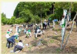
植樹行事(第72回滋賀県大会)