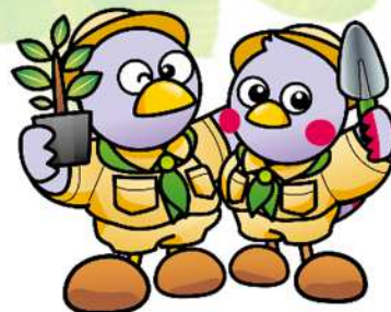
埼玉県マスコット 「コバトン&さいたまっち」

※1 例:植樹祭で使用する移植ごて、飲料水など ※2 例:広告掲示、輸送運搬等の役務の提供