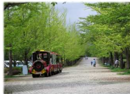
秩父ミュージックパーク (秩父市・小鹿野町)