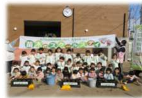
関連事業 (苗木のスクールステイ)