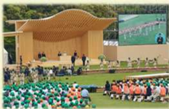
式典行事(第70回愛知県大会)