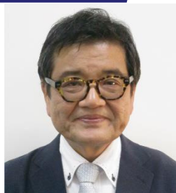
森永卓郎 経済アナリスト